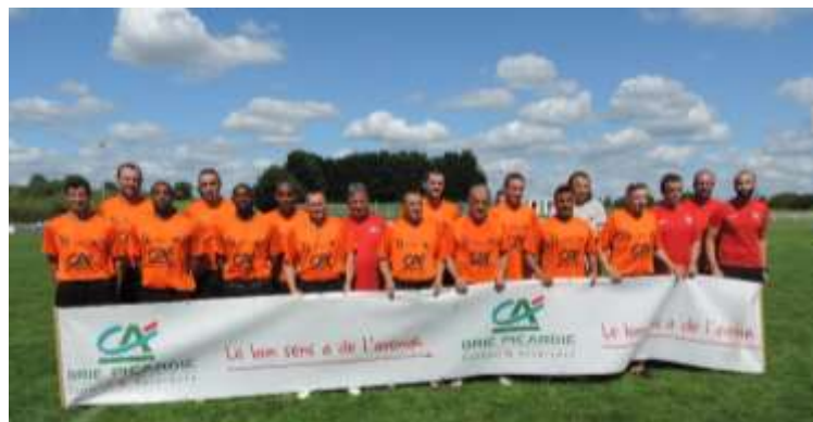
ES VALOIS MULTIEN

Un après-midi placé sous le signe du soleil et du fair play, devant un très nombreux public, et un excellent arbitrage.