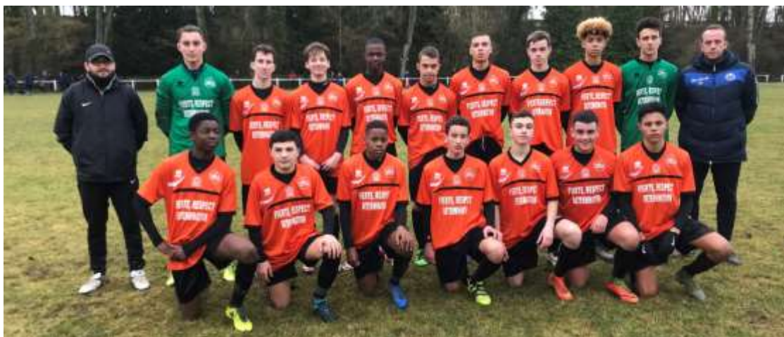
Texte et photo : Pascal LEFEBVRE

Félicitations à l'ensemble de ces joueurs, à leurs clubs et à l'encadrement pour ces brillants résultats et surtout pour la qualité du jeu proposé dans le respect du projet du jeu départemental.