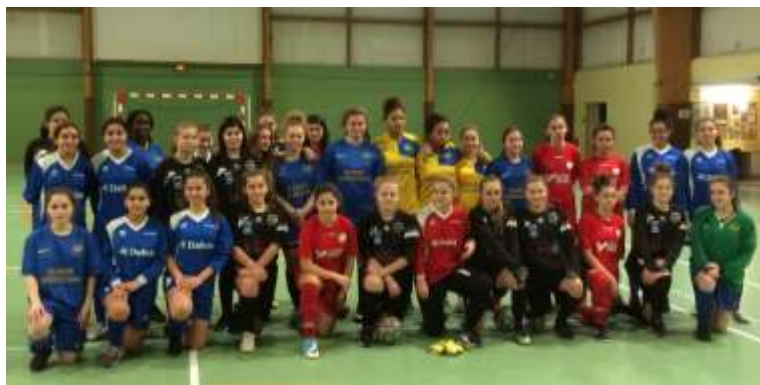
Equipes présentes : AS Beauvais, US Nogent, US Chevrières/Grandfresnoy, CS Chaumont et l'AS Noailles.