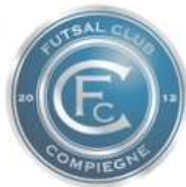
ASC Compiègne Futsal

2018 : ..... 2017 : Aclès St Just 2016 : FC Compiègne